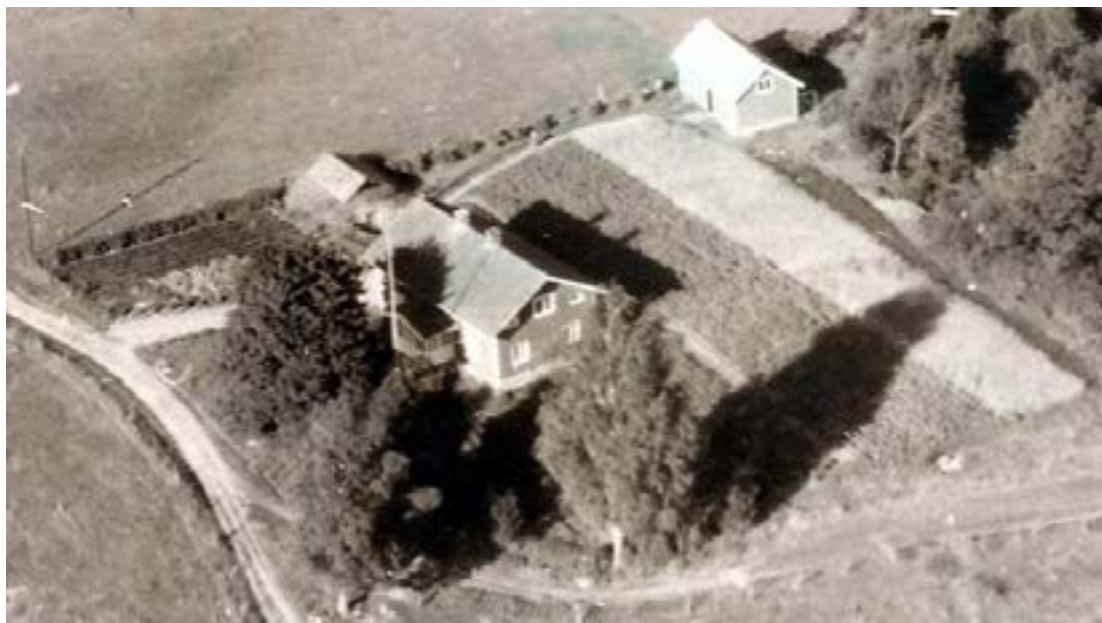
Flygfoto av Kvarngården i Södra Säm