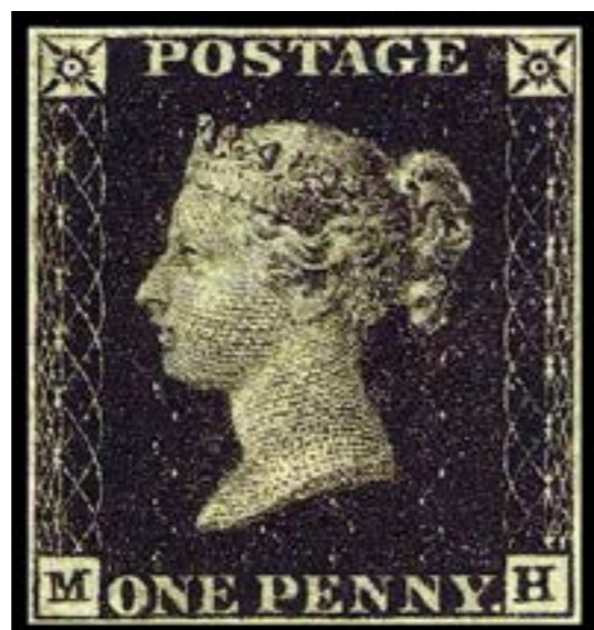
Frimärket "One penny black"

Världens första frimärke, kom ut i England den 6 maj 1840, och kallades " One penny black ", för sin svarta färg, och har en kvinna i profil. Efter frimärkets införande, fick Englands postväsende ett ordentligt uppsving, och exempel fick snabbt efterföljd i andra länder. Det skulle dock dröja femton år innan Sverige hakade på. Det första svenska frimärket gavs ut den 1 juli 1855, och har "Riksvapnet i sköld" som motiv. Detta finns givetvis inte i Johns samling.