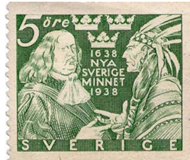
Frimärket från 1938 "Nya Sverige"