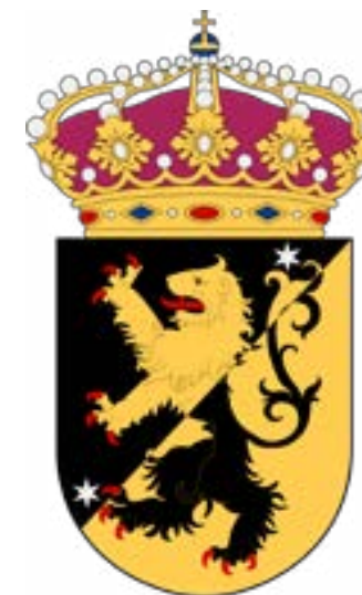
Vapenbild för Kungl. Västgöta regemente