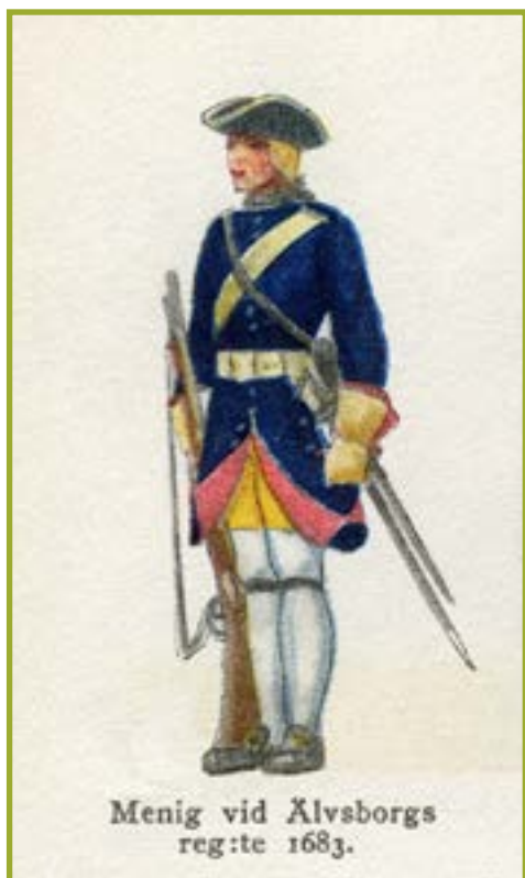
Militär närvaro i Ulricehamn ...