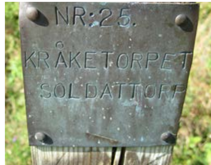
Torpskylt för soldattorpet Kråketorpet