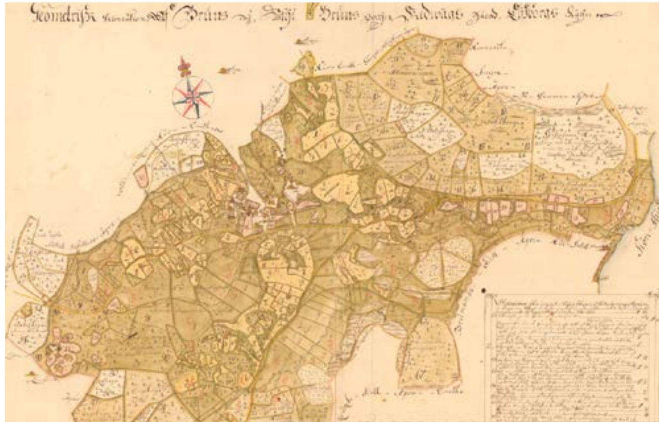
Karta över Brunn 1734

Landskapen som omger oss är laddade med mening och namnen på platser ute i skogarna och bygderna är koder till budskap från tider som flytt. Ortnamn kan vara våra allra äldsta historiska källor. Vid studier av lantmäteriets historiska kartor kan man ibland hitta namn på gårdar som inte längre finns och i vissa fall inte ens fanns när kartan ritades. På en karta från 1734 över Brunns sockens centrala delar finns en stor och avgränsad äng och beteshage med namnet Solberga.