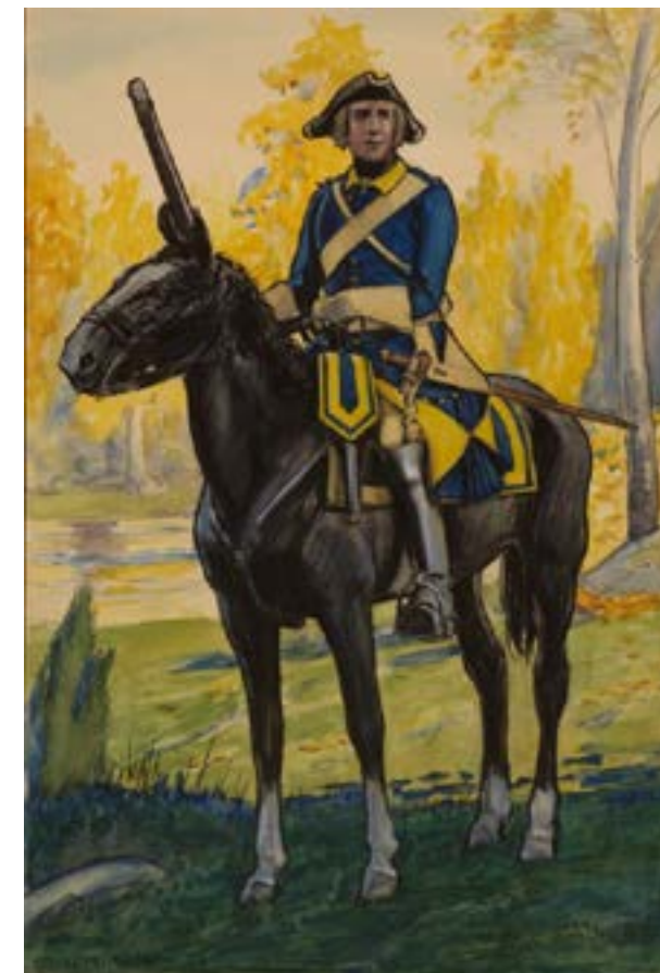
Ryttare vid Västgöta kavalleriregemente 1748. Illustration av Einar von Strokirch