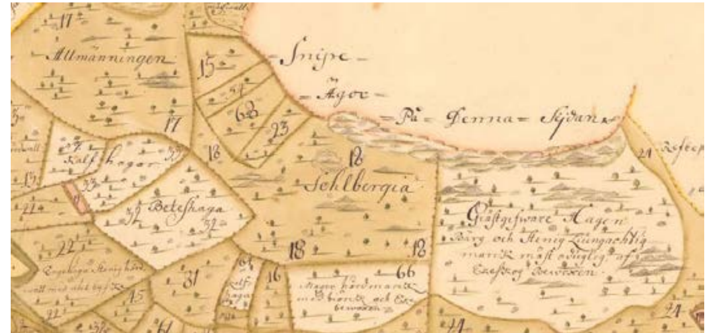
En del av kartan över Solberga 1734

I svenskt ortnamnslexikon tar man upp 8 exempel.