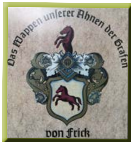
Släkten von Frick's vapensköld