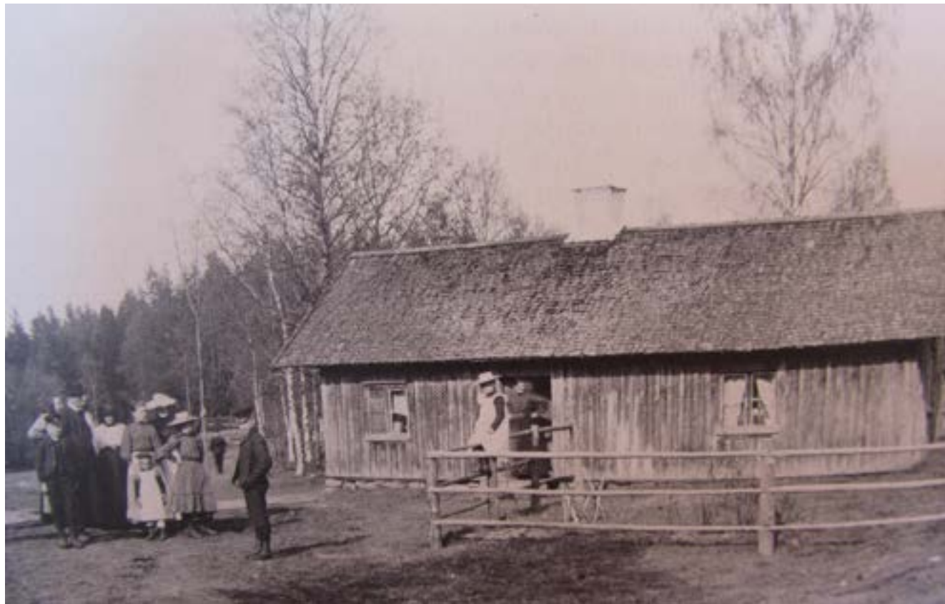
Åsarp Nedregårdens soldattorp "Kråketorpet", 1903