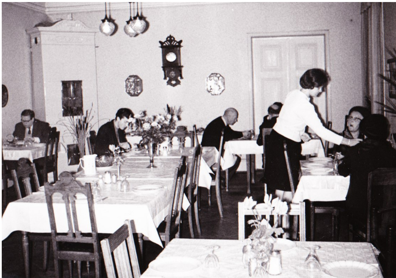
Gästerna börjar komma.

I vårt medlemsblad hösten 2018, hade vi en artikel om Stenlundshuset, och utlovade då eventuellt lite om pensionatet, beläget på andra våning i huset. Något som nu flera uttryckt önskemål om.