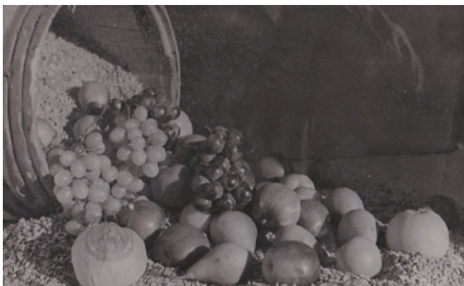
Vindruvor varvade med korkspån.