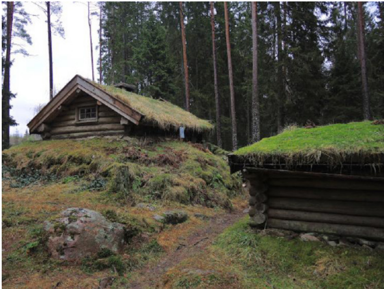
Bild på Jordkulan.

Det har blivit tradition att medlemmarna i Ulricehamnsbygdens forskarklubb varje år, någon gång i maj, hälsas välkomna till en vårutflykt för ett besök på någon plats i kommunen. I år var det alltså jordkulan i Nöre, belägen i Fredsskogen mellan Dalum och Timmele. Numera ett välbesökt utflyktsmål.