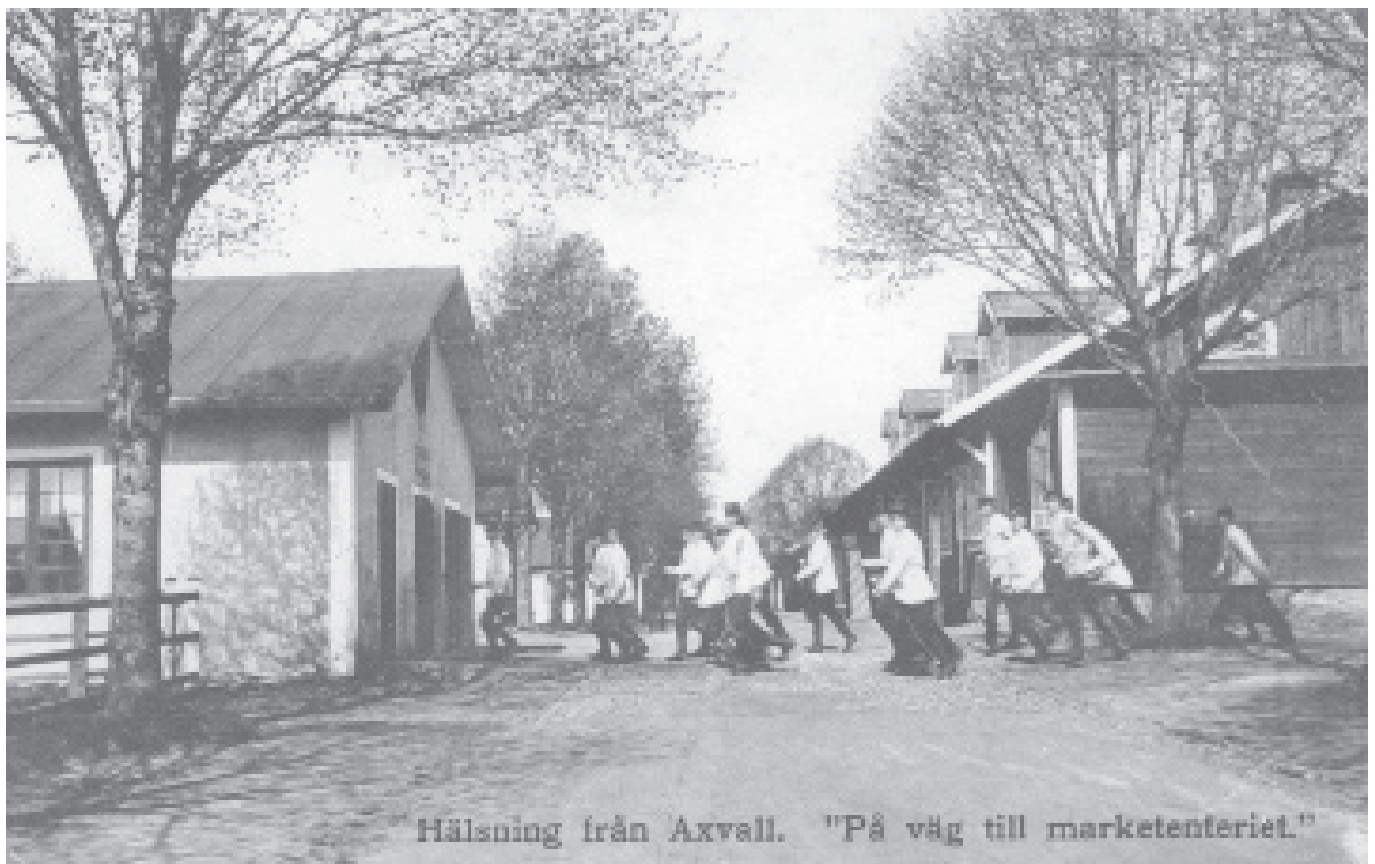
Hälsning från Axvall. "På väg till marketenteriet."

Databasen som finns på Linköpings Universitets databas har omkring 950 000 besökare årligen, vilket gör den till en av de mer besökta enskilda baserna på universitetets stora server. Databasen som finns under registrets hemsida med adressen www.soldatreg.se , har blivit en god källa till den egna forskningen både för den akademiska forskningen som för hembygds- och släktforskarna.