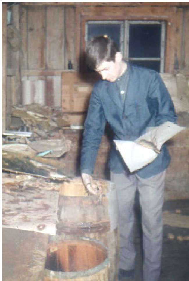
"Sillastrypare" på Bröderna Stenlunds Eftr. 1965.

Fortsättningsvis ett år som ALU-samordnare på Ulricehamns kommun följt av en anställning som uthyrningsansvarig vid STUBO, (Stiftelsen