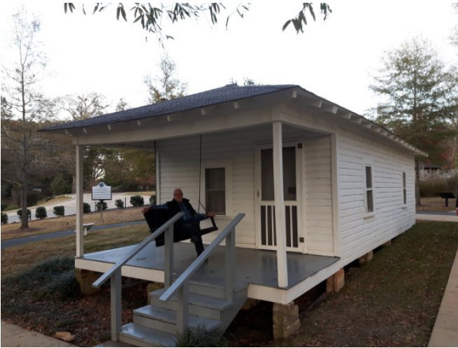
Tupelo, Mississippi USA. Här föddes Elvis Presley 8 jan. 1935.

Göteborgsvarv, innan jag fyllde femtio. Något som krävde mycket träning”, säger han.