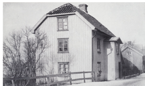
Ulricehamns fattighus vid Lindängsvägen, var i bruk från 1827 till 1912

1827 fattades sedan beslut om ett nytt fattighus, enär det gamla befann sig i ett förfallet skick, och dessutom var trångt och överbefolkat. Men istället för att bygga, inköptes det så kallade "Besekska huset", vid Lindängsvägen, till ett pris av 350 riksdaler. Huset genomgick en grundlig reparation år 1880, och tjänstgjorde sedan i ytterligare över trettio år.