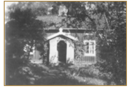
Stenstorp, Sjölanders hem.

rum i Stenstorp. När det gällde att måla de stora altartavlorna bereddes han dock möjlighet att använda ett större utrymme på Bredgården.