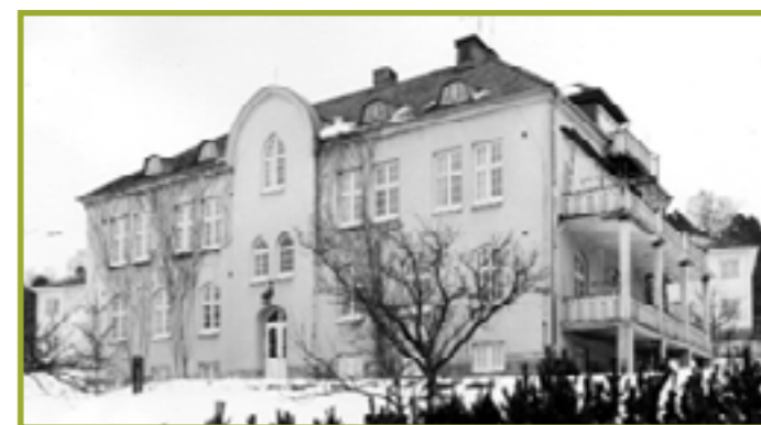
Foto taget tidigast 1954. Man ser brandbalkongen, brandtrappan och den stora solverandan på södra gaveln. Tegelfasaden har täckts med ljus puts. De fastigheter som skymtar till vänster och höger i bildens bakkant finns inte längre kvar.