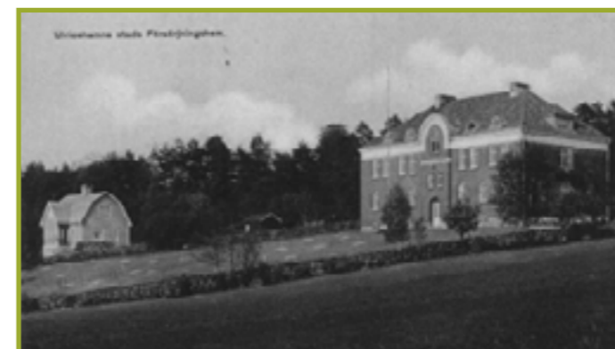
Tidigt foto märkt "Ulricehamns stads försörjningshem". Man skymtar de många planteringarna i den stora trädgården på framsidan och den låga stenmuren i backen upp mot entrén.