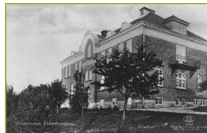
Ett senare foto märkt "Ulricehamns ålderdomshem". Två dominerande detaljer på den södra gaveln är takkupan till vindsrummet och piskbalkongen på plan 2 i kvinnornas bostadsavdelning.