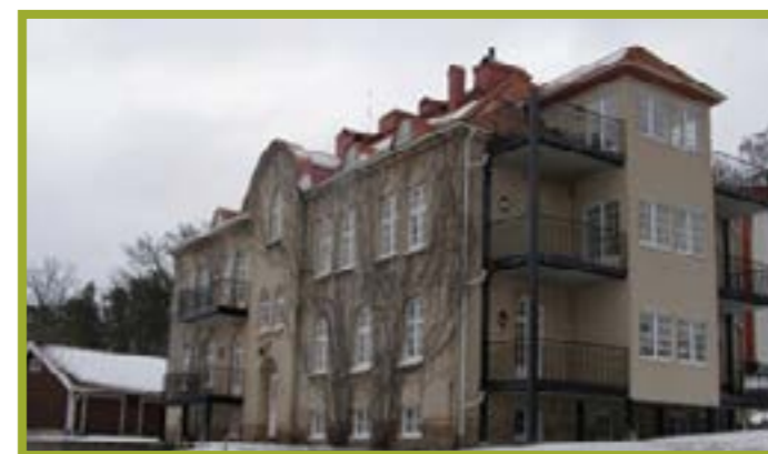
Fastigheten fotograferad vårvintern 2016. Efter en omfattande renovering och ombyggnad inrymmer huset tio lägenheter. I det rymliga trapphuset finns nu också hiss. På utsidan är mycket sig likt men södra gavelns mitt har förlängts och nya balkonger har monterats. En handikappanpassad entré har tillkommit på baksidan. Till vänster i bild skymtar garaget som uppfördes 1977.